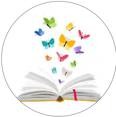
LA PLUME DE CARNOLS

La bibliothèque est toujours ouverte et les bénévoles vous attendent ! Et en cette période estivale, quoi de mieux qu'un bon bouquin pour la plage ou la piscine.