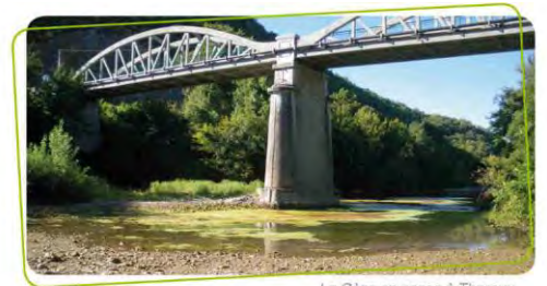
La Cèze en assec à Tharaux